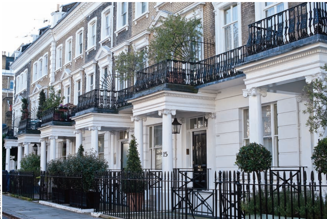
SOUTH KENSINGTON On peut y vivre comme à Paris.

La plupart des familles françaises sont installées dans les quartiers de South Kensington et Chelsea, du fait de la proximité du lycée français Charles-de-Gaulle, du consulat et de l'Institut français. Les librairies, les boutiques et les commerces de bouche français foisonnent et on peut vivre dans ces quartiers comme à Paris ou en province, en mangeant un saint-nectaire, un verre de côtes-du-rhône à la main tout en suivant un match de Ligue 1... L'atmosphère villageoise de Notting Hill, Putney et Chiswick est appréciée de nombreuses familles françaises, qui sont aussi légion dans les quartiers de Fulham, Ealing et Clapham en raison de la présence de trois écoles primaires dépendant du lycée