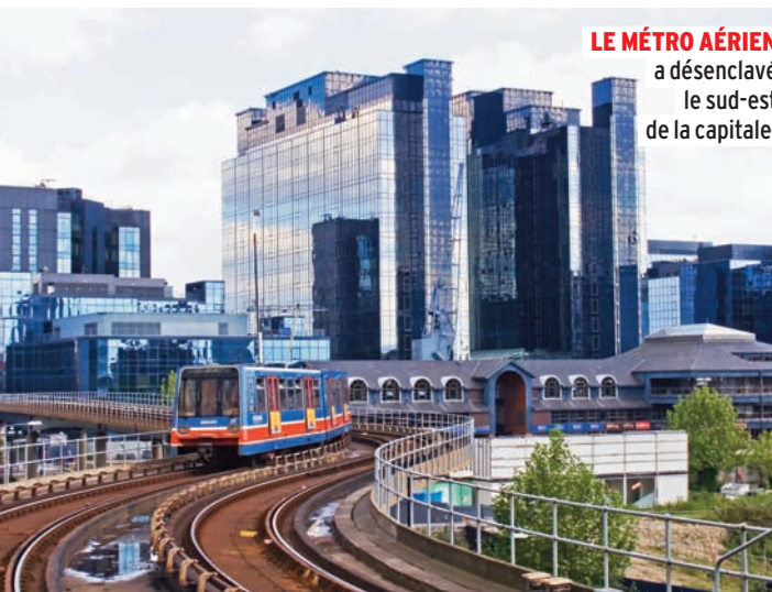
LE MÉTRO AÉRIEN a désenclavé le sud-est de la capitale.

Le charmant petit quartier de Blackheath, dans le sud-est de Londres, est à cheval sur les boroughs de Lewisham et Greenwich. Situé à proximité de la Tamise, Blackheath a longtemps été délaissé par les Londoniens à cause de l'absence de métro. Ce n'est plus le cas aujourd'hui grâce au DLR (le métro aérien), et les familles attirées par l'atmosphère tranquille viennent désormais s'y installer. La gare ferroviaire de Blackheath permet aussi de gagner London Bridge rapidement. Le cœur du quartier, surnommé Blackheath Village, compte de belles maisons victoriennes et georgiennes ainsi que quelques cottages, de nombreux restaurants et des pubs. Près de South Row se trouve le joyau de Blackheath, le Paragon, un ensemble architectural conçu à la fin du XVIII e siècle par l'architecte Michael Searles. Il s'agit de grands immeubles en brique reliés les uns aux autres par de longues colonnades blanches. Se loger ici coûte évidemment plus cher et les appartements libres sont rares. Les endroits les moins chics sont situés aux abords de Kidbrooke et de la cité de Ferrier Estate, dans le borough de Greenwich. Les espaces verts et plats de Blackheath seront appréciés des joggers tandis que Greenwich Park, nettement plus vallonné, offre d'impressionnantes vues sur Londres.